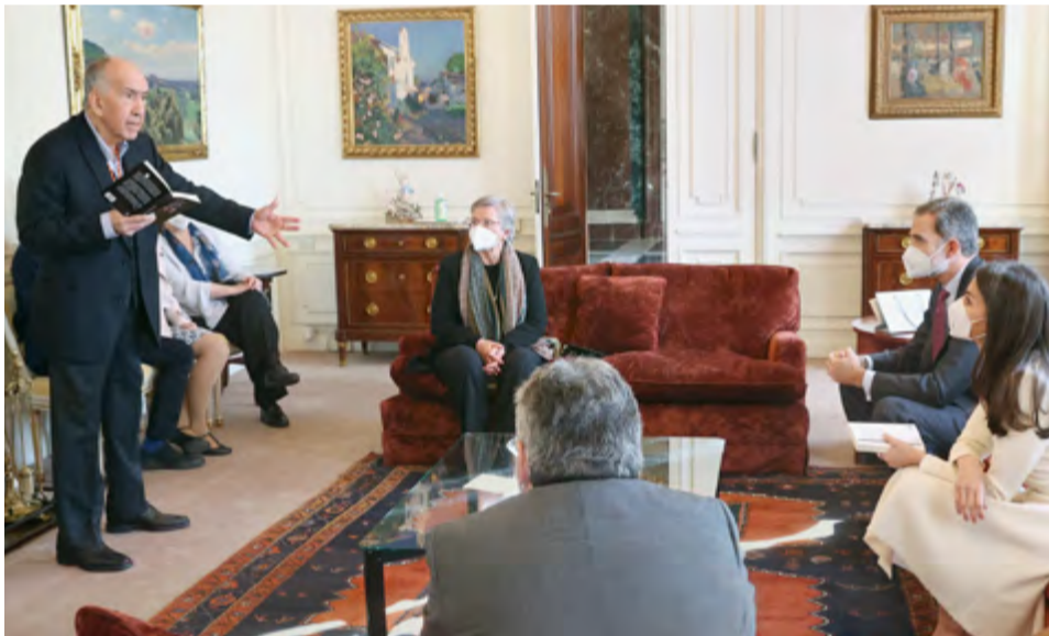
El poeta Joan Margarit lee algunos de sus poemas ante los Reyes tras recibir el Premio de Literatura en Lengua Castellana Miguel de Cervantes 2019 en un acto privado celebrado en el Palacio Albéniz de Barcelona el 21 de diciembre de 2020, que había sido pospuesto a causa de las restricciones por el coronavirus.