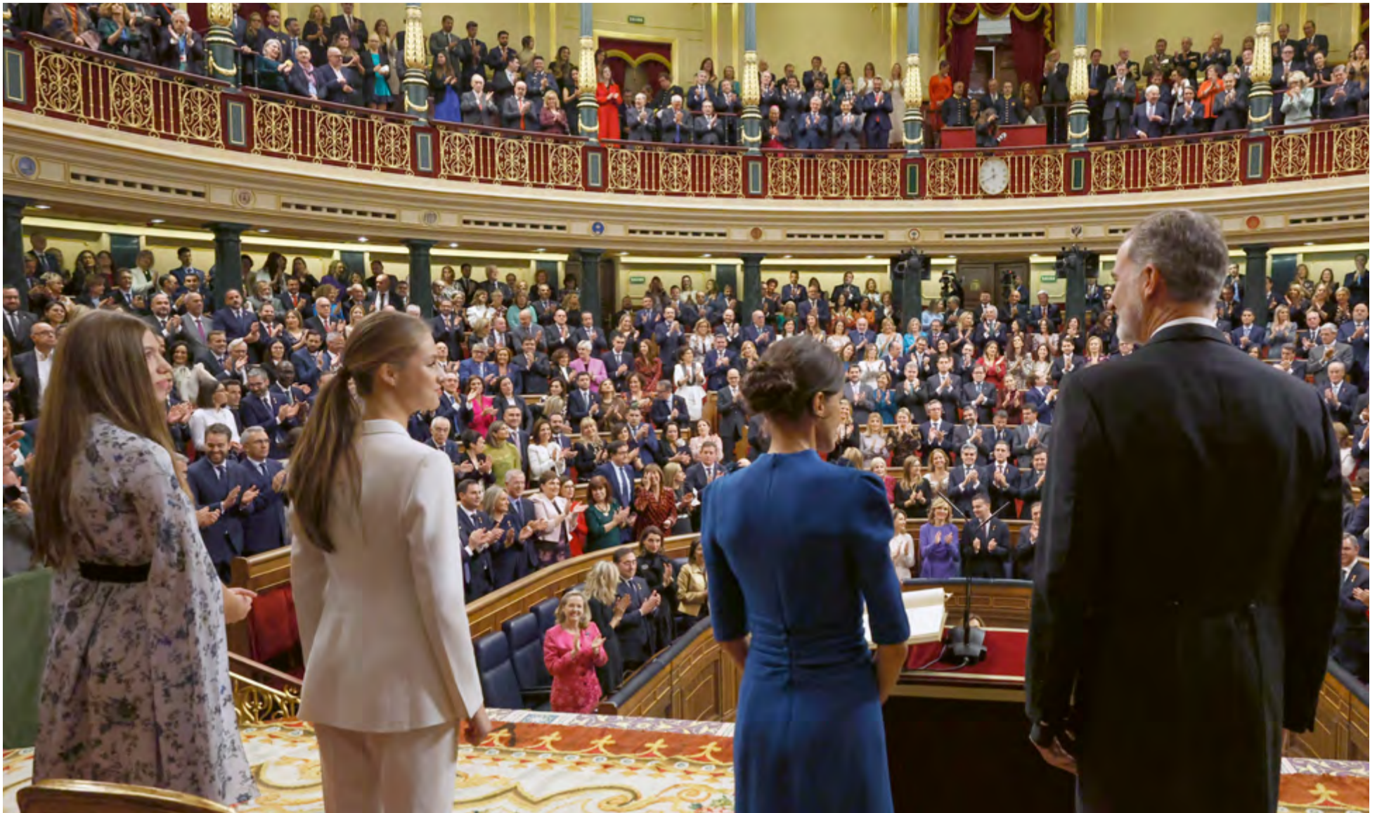
El día de su 18 cumpleaños, la Princesa de Asturias prestó juramento de acatamiento a la Constitución Española como heredera formal de la Corona ante el pleno de las Cortes Generales, reunidas en sesión conjunta del Congreso de los Diputados y del Senado, 31 de octubre de 2023.