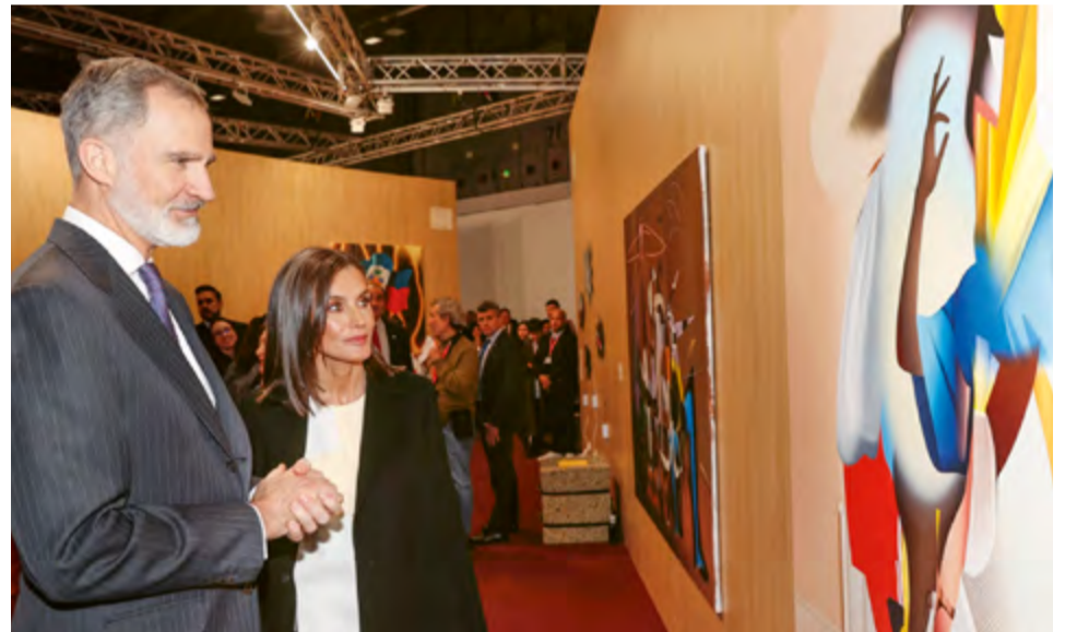
Los Reyes presiden la inauguración de la 43.ª Feria Internacional de Arte Contemporáneo-ARCOmadrid, pieza imprescindible en el circuito internacional de promoción y difusión de la creación artística, 6 de marzo de 2024.