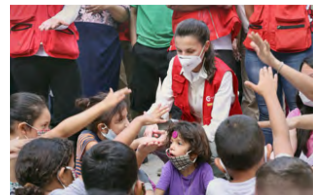
La Reina visita el albergue instalado en el Instituto Patria de La Lima durante su viaje de ayuda humanitaria a Honduras, 16 de diciembre de 2020.