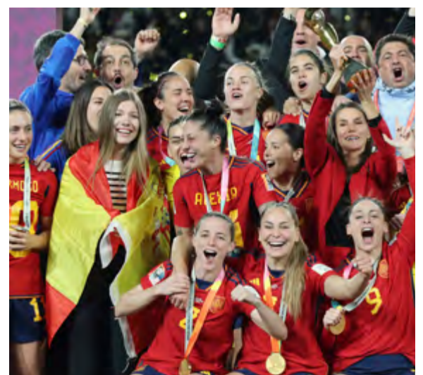
Uno de los rasgos que caracteriza a la Familia Real española es su pasión por el deporte y su apoyo a nuestros deportistas. Fieles a ese compromiso, el Rey quiso animar desde las gradas a Rafael Nadal, que alcanzó su decimocuarto título de Roland Garros el 5 de junio de 2022, y la Reina y la Infanta Sofía celebraron con la selección femenina de fútbol el triunfo en la Copa Mundial disputada en Australia y Nueva Zelanda, 20 de agosto de 2023.