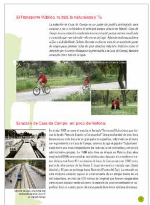
Ejemplo de libro de ruta descargable en PDF por el excursionista