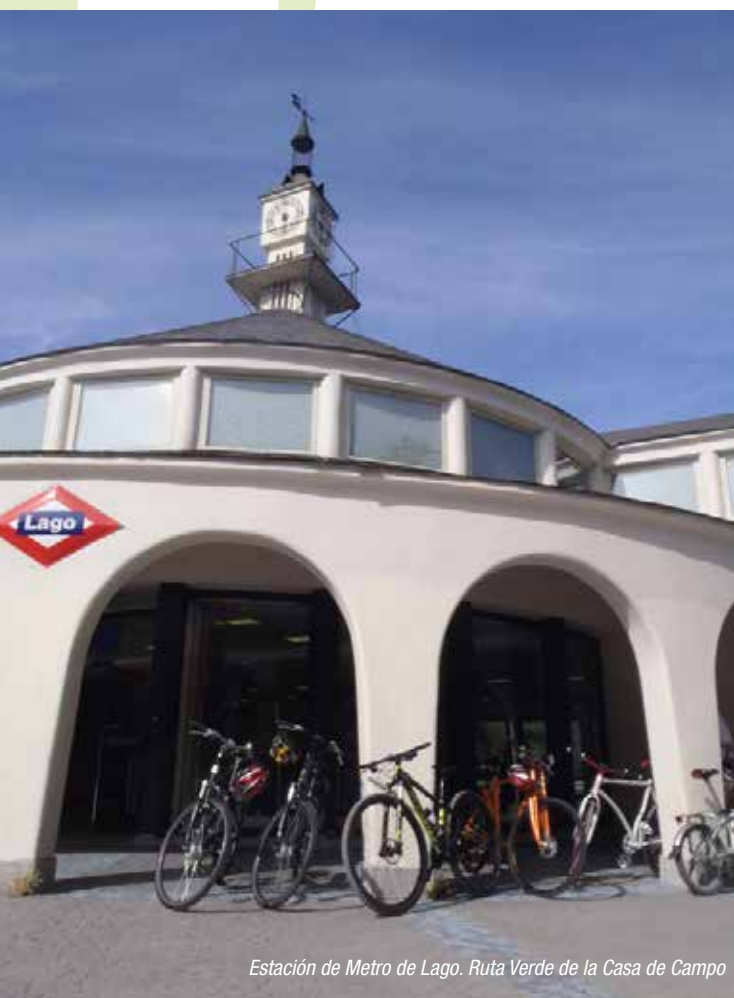
Estación de Metro de Lago. Ruta Verde de la Casa de Campo

Numerosas estaciones de la red de transporte público de la Comunidad de Madrid que están ubicadas en las proximidades de algunos de estos espacios naturales pueden ser el punto de partida para disfrutar de una jornada de ocio activo. El Consorcio Regional de Transportes (CRTM) creó en 2011 las llamadas “estaciones de acceso a Ruta Verde”, puntos de la red de transporte donde se pueden comenzar rutas muy sencillas, aptas para todos los públicos y que ponen en valor rincones y facetas desconocidas de la región.