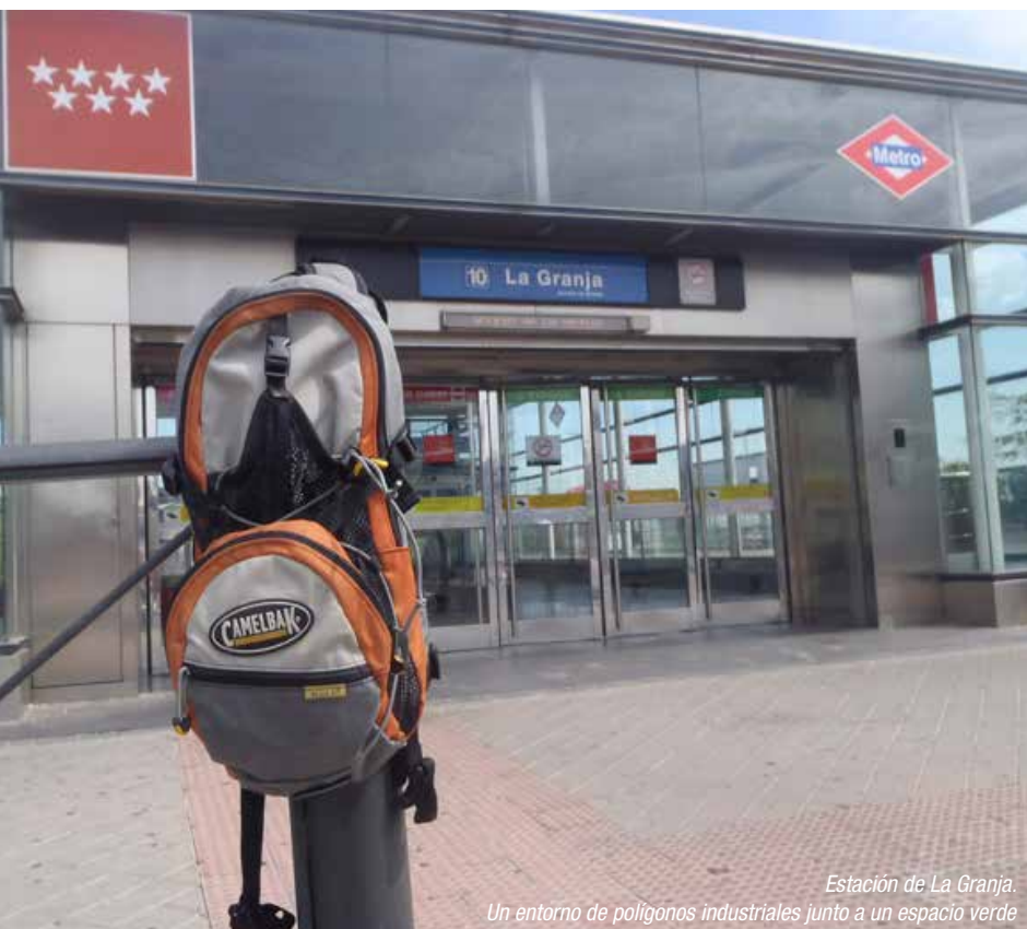
Estación de La Granja. Un entorno de polígonos industriales junto a un espacio verde

Desde el CRTM se fomenta el uso de la red de transporte público en las estaciones ubicadas en determinadas zonas de baja demanda en fin de semana: polígonos industriales o áreas empresariales que sin embargo tienen ubicaciones muy cercanas a interesantes zonas verdes como en el caso de La Granja (Alcobendas), situada a escasos 400 metros del monte de Valdelatas, entre Madrid y Alcobendas.