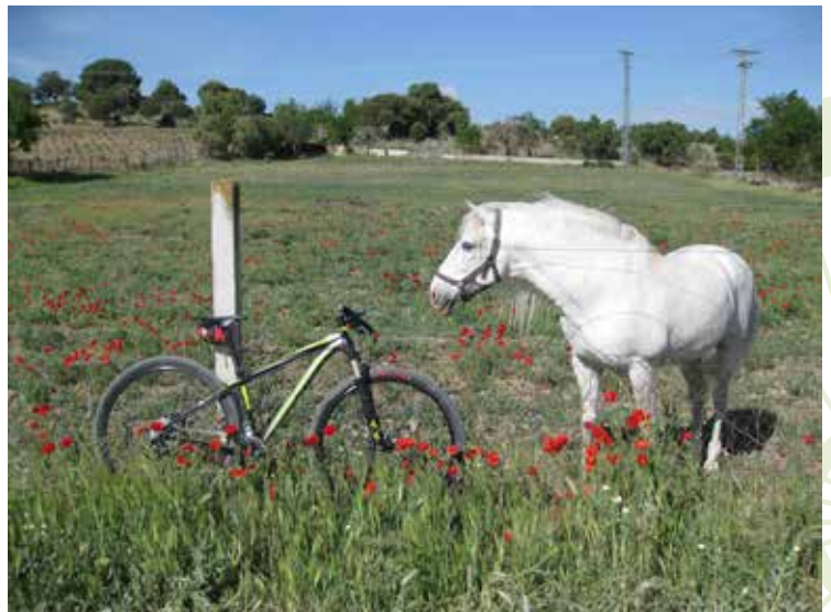
En el valle del Guadarrama. Ruta de Móstoles a Sevilla la Nueva

Todos los itinerarios y sus respectivos libros de ruta están disponibles en la página web del Consorcio Regional de Transportes www.crtm.es