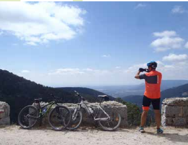
La Fuenfría. Camino de Santiago desde Madrid