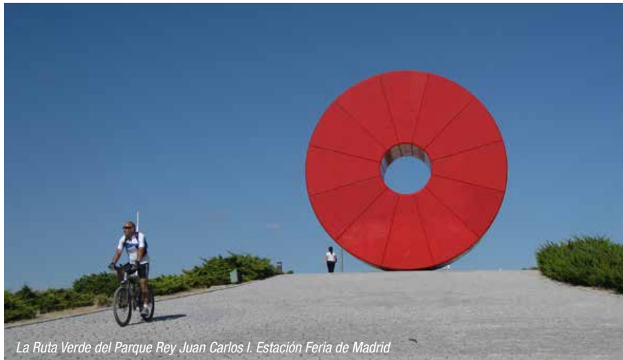
La Ruta Verde del Parque Rey Juan Carlos I. Estación Feria de Madrid