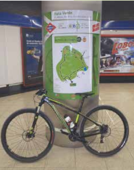
Cartel señalizador de ruta en una estación de metro

Cada estación de acceso a Ruta Verde dispone de una serie de elementos informativos que permiten conocer un poco más su entorno y las posibles rutas a realizar desde la misma, así como un cartel descriptivo en la propia estación donde figura el itinerario a realizar. Como se trata de recorridos por espacios urbanos o por parques bien señalizados son muy sencillos de seguir y no requieren de señalización específica a lo largo de la ruta.